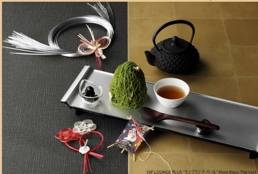
19F LOUNGE PLUS “モンブラン テーパール” Mont Blanc Thé Vert