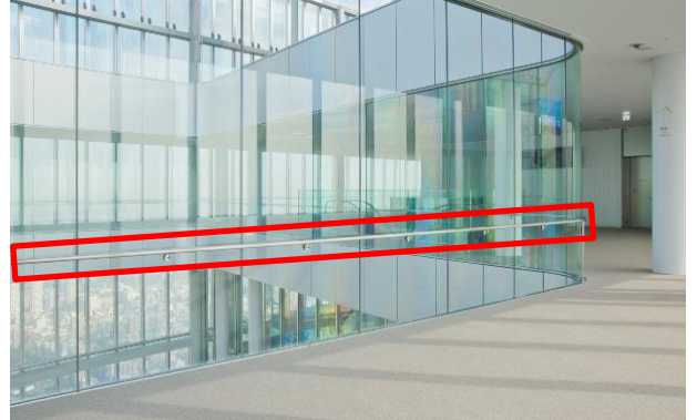
60階 天上回廊内手すり