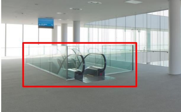
58-60階 展望台内エスカレーター手すり