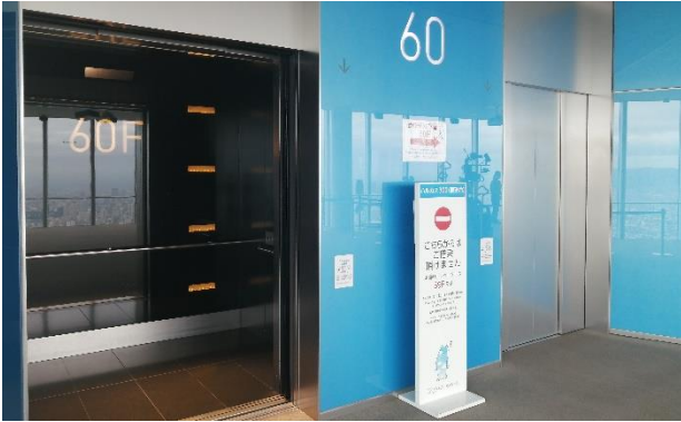
16-60階 展望台用エレベーター内（下記②）