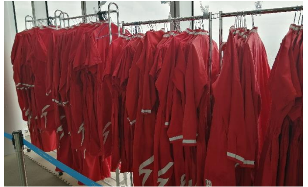
エッジ・ザ・ハルカス ユニフォーム （コーティング加工を実施）