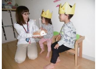
《お誕生日会》 4月生まれのお友だちは、とっても照れ屋さんでもプレゼントを貰うとニコニコ笑顔☆