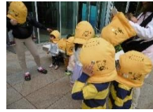
《避難訓練》 非常口から階段を降りて16階庭園まで避難しました。 初めて参加のお友だちも慎重に階段を降りましたよ☆