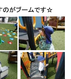
《トリムパーク》 どの遊具もみんな大好き！ 「よいしょっ」の掛け声と共に一輪車を押すのがブームです☆