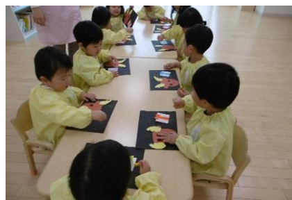
製作をしている様子