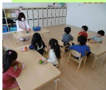
MATHアクティビティの様子(2歳~対象)