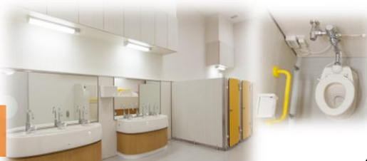
トイレトレーニングもしています