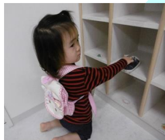
靴は自分で下駄箱に入れます

ロッカーは1歳児でも安全に出し入れができるように全て指詰め防止されています。安全に配慮した上で、「自分でやりたい」子どもの気持ちを大切にしています。