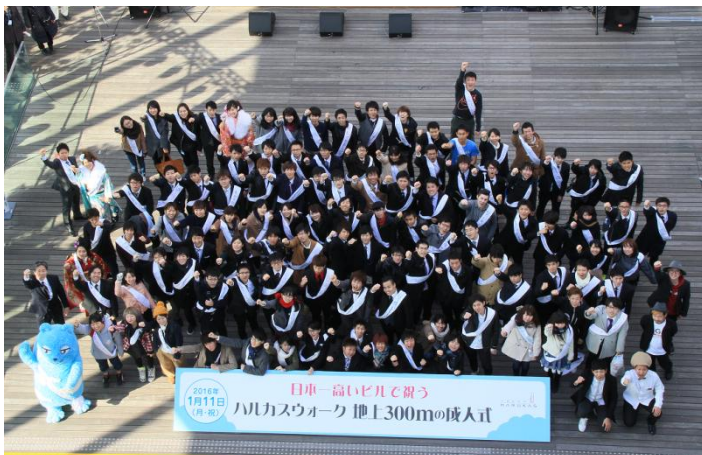
参加者の記念撮影の様子 (第3回ハルカスウォーク)