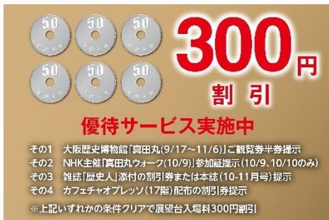
割引サービスアイキャッチ(イメージ)