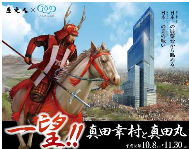
イベントメインビジュアル