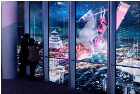
「大坂 天空の陣」イメージ