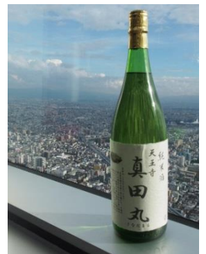
天王寺区限定日本酒「真田丸」