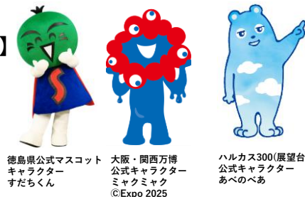
徳島県公式マスコットキャラクター すだちくん 大阪・関西万博公式キャラクター ミyakミyak ハルカス300(展望台)公式キャラクター あべのべあ ©Expo 2025

徳島県のマスコットキャラクターの「すだちくん」と大阪・関西万博公式キャラクター「ミyakミyak」が当日は参加。阿波おどりを一緒に踊り、イベントを盛り上げます。また、ハルカス300（展望台）では「あべのべあ」も登場します。