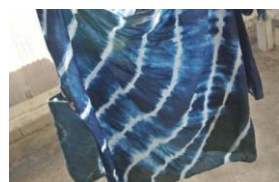
ゼロ・ウェイスト体験