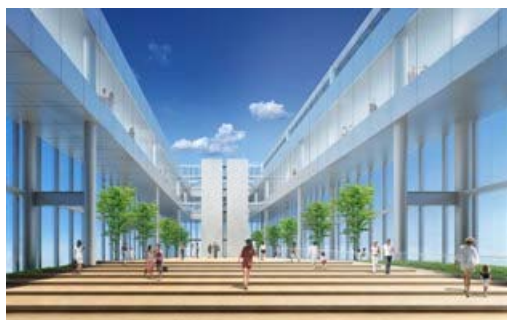
58階屋外広場 イメージ

※当日券のほか、日付と時間を指定できる「日時指定券(事前発売)」も導入します。日時指定券については、上記の個人料金に500円(一律)を加算いたします。