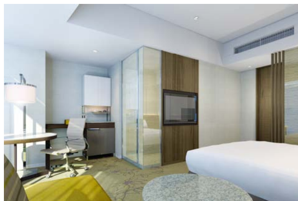
客室イメージ （スーペリアルーム：ダブルルーム）