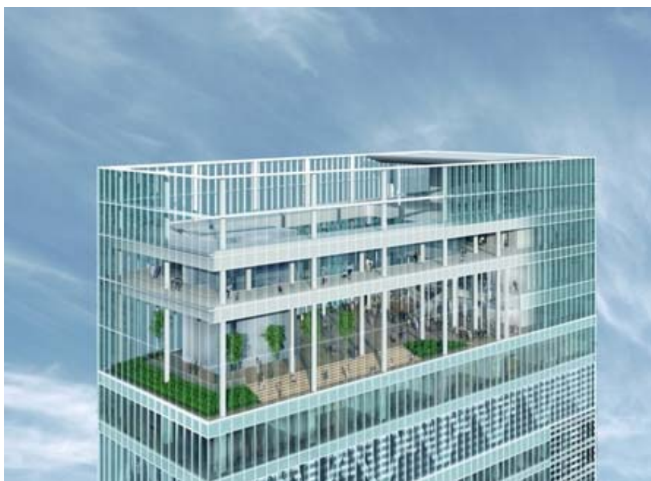
ハルカス300 全体イメージ

個人入場券の発売開始については、平成26年1月頃を予定しております。発売日、発売箇所、発売方法等については決まり次第、お知らせいたします。