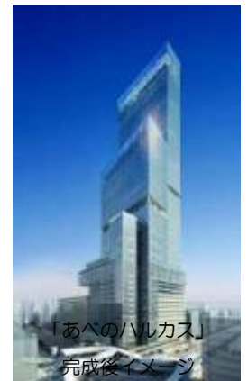
「あべのハルカス」 完成後イメージ