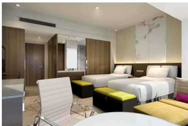
客室イメージ （スーペリアルーム：ツインルーム）

※客室は全てツインルームまたはダブルルーム仕様で、定員は2名を基本としています。