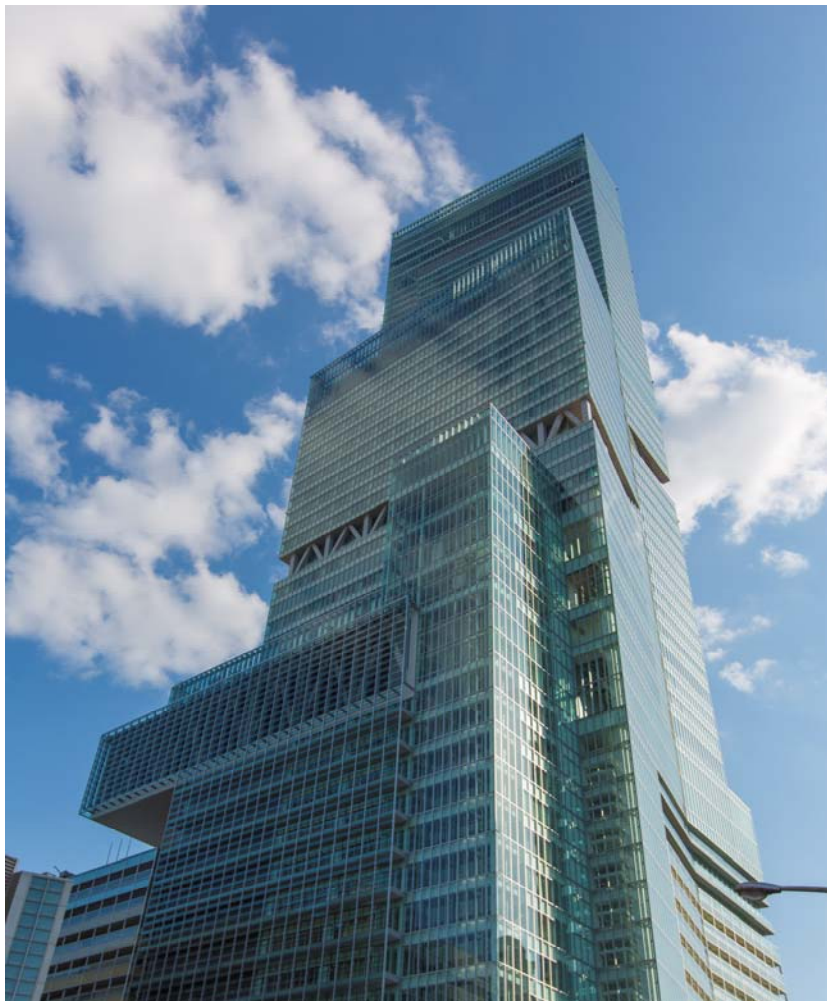
「あべのハルカス」外観