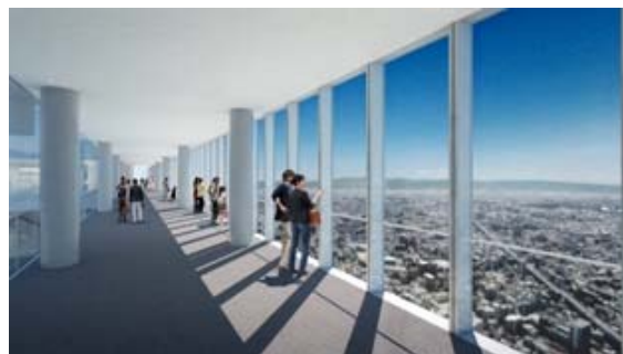
60階屋内回廊 イメージ