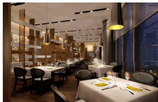
57階レストラン イメージ