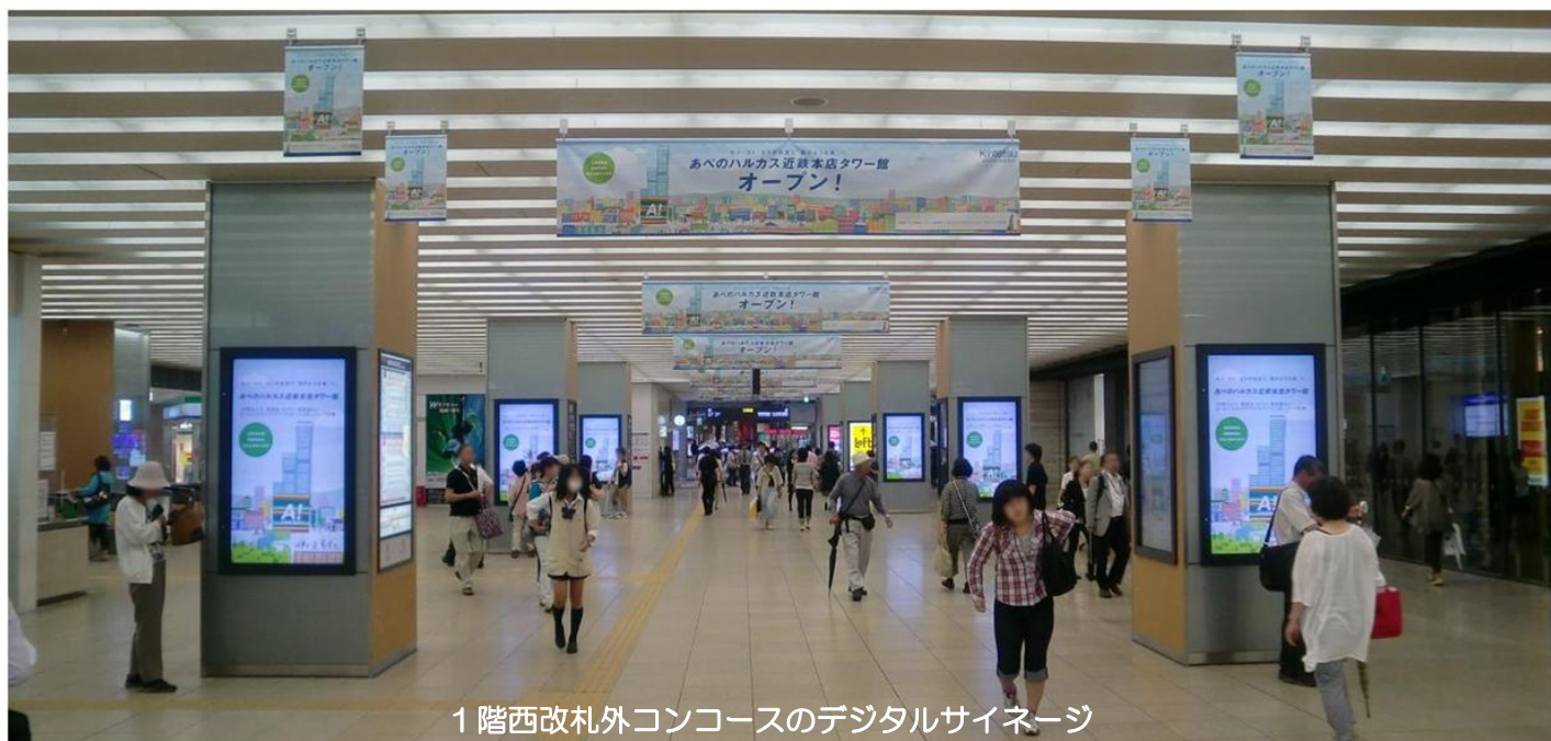
1階西改札外コンコースのデジタルサイネージ