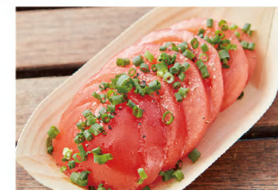
차가운 토마토 400 Cold Tomato