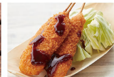
꼬치튀김 3개 500 Skewers Special Sauce (Three)