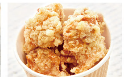
닭 가라아게 (튀김) 500 Fried Chicken