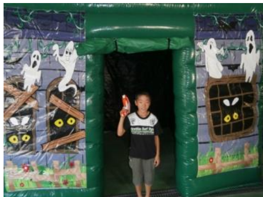
お化けシューティング