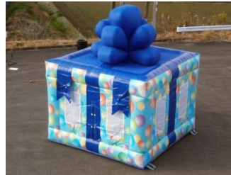
プレゼントボックス