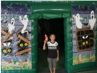
お化けシューティング