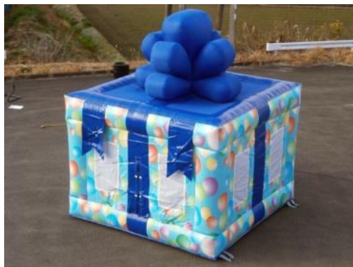
プレゼントボックス